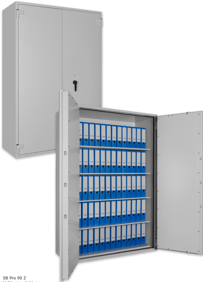
SB Pro 90 Z Lichtgrau • light grey Dekoration nicht im Lieferumfang enthalten • decoration not included in the delivery

■ Versicherungssumme nach Absprache mit dem Versicherer