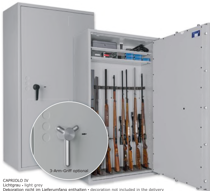
CAPRIOLO IV Lichtgrau • light grey Dekoration nicht im Lieferumfang enthalten • decoration not included in the delivery